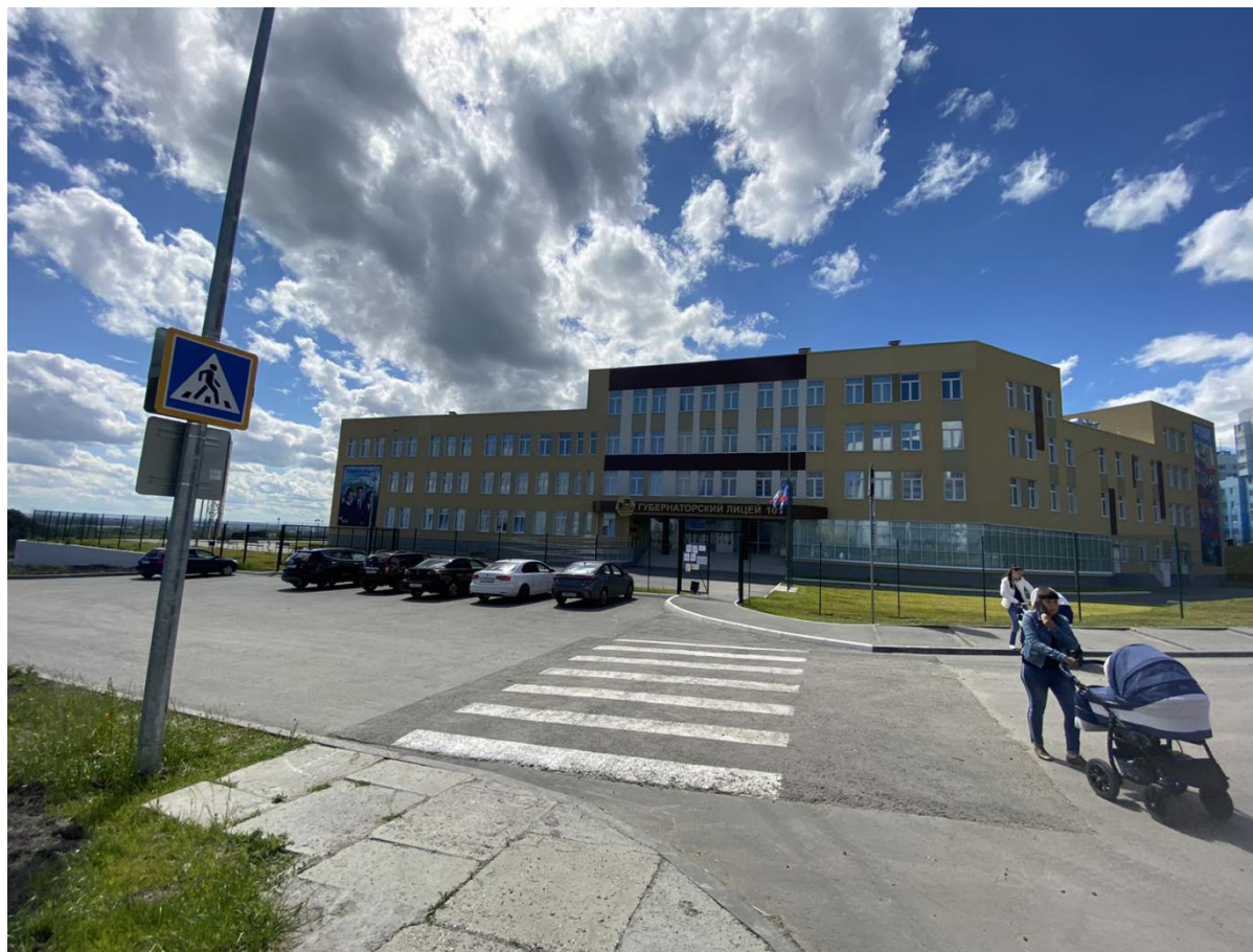
Пути подъезда к зданию МБОУ г. Ульяновска «Губернаторский лицей № 101»